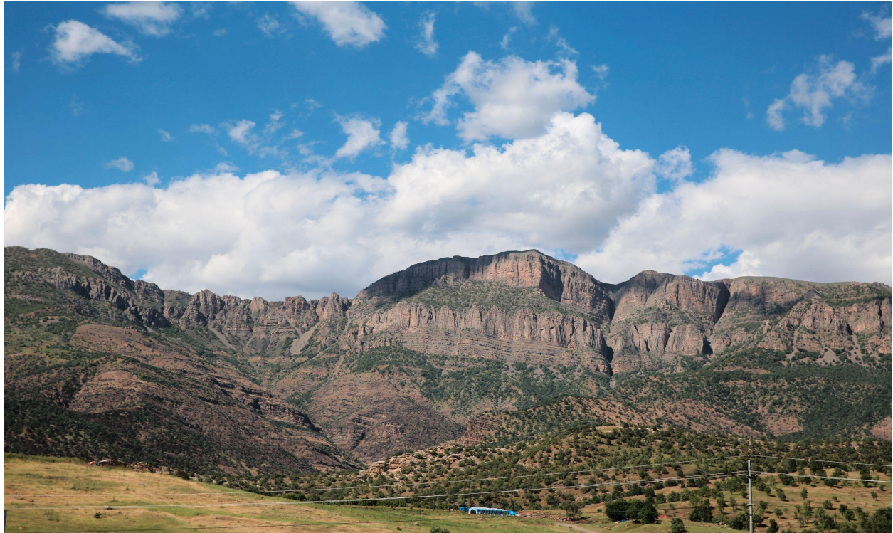
بێستانیکی سوتاو به‌هۆی بۆردوومانه‌کانی تورکیا له‌ زناری کێسته.

زناری کێسته ده‌که‌وێته چهند کیلۆمتریک له‌ خوار باشوری سنوری نیوان تورکیا-عیراق و ۲،۳۰۰ کیلۆمتر له‌ ئاستی رۆوی ده‌ریاو به‌رزه و به‌ به‌رزترین شاخ دادهنریت له‌ سنوری ناحیه‌ی کانی ماسی-دا. پانتایی دامینی چپاکه به‌ داری میوه و زه‌وی کشتوکالی و له‌مه‌رگای ئاژم‌ل داپۆشراوه که سه‌رچاوه‌ی دابینکردنی بژییۆی ژیا‌نی زیاتر له‌ هه‌زار هاولاتی گونده‌کانی کێسته، هرورئ، چهلکئ، ئوره، ئه‌ندئ، سه‌ررۆ، دشیشی، میسکه و گونده‌کانی ترن. به‌ر هه‌می سه‌رکه‌ی ئه‌و گونده‌کانه‌ میوه، سه‌وزه، مزره‌مه‌نی و گیای خۆرسکه. وه‌ ئه‌و گونده‌کانه‌ رێژه‌یه‌کی زۆری هه‌نگوین، ماست، گوشت و هه‌یلکه به‌ر هه‌م ده‌هین.