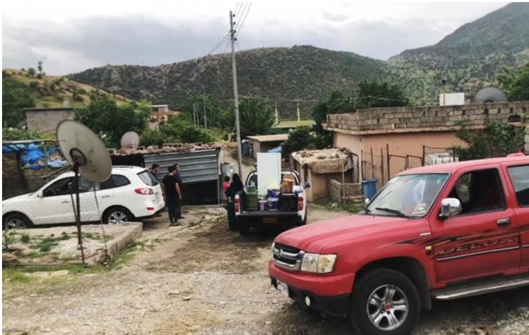
لهوای بۆردوومانکردنی گوندهکهیان، گوندشینیانی کیشه گوندهکهیان بهجیدههیلن.

تاوهکو کۆتایی مانگی ئایار، بهلایهنی کهمهوه ۷۲۰ هاوآلتی مهدهنی له گوندهکانی کیشه، چهلکی، ههروزی، ئەدنی، میسکه، سههرهۆ و دشیشی بههۆی ئۆپهراسیۆنی چنگی-ههوره بروسکهوه گوندهکانیان چۆلکردوه و ناوارهبوون.